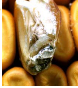
Arpa güvesi zararı