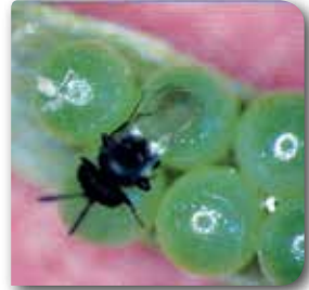
Yumurta Parazitoiti Trisolcus