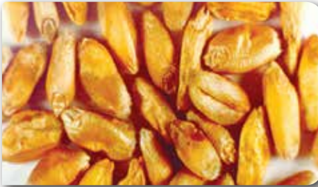
Süne emgili dane