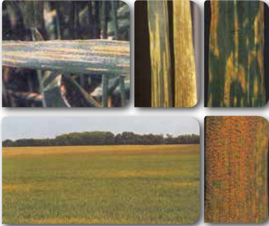
En erken görülen pas türüdür.