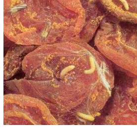
Kuru meyve güvesi zararı